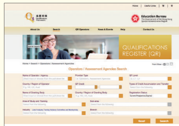
*「資歷名冊」搜尋頁面，可以不同關鍵字搜尋資歷。